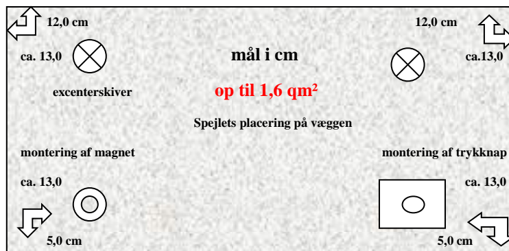
Illustration 2: Placering af ophængningsplader og tilbehør på spejlets bagside