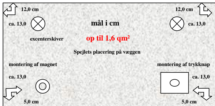
Illustration 2: Placering af ophængningsplader og tilbehør på spejlets bagside